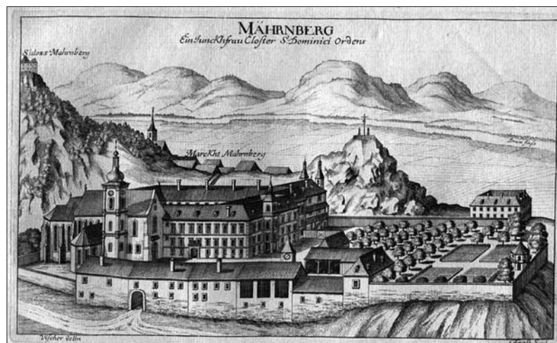
V ospredju samostan dominikank, v ozadju marenberški grad (Schloss Mahrnberg) na hribu Kamen, trg, Kalvarija in dvorec (Georg Matthäus Vischer: Topographia Ducatus Stiriae ).