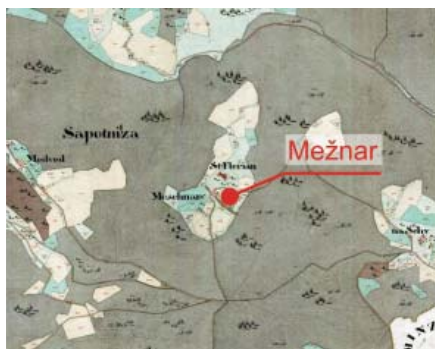
Mežnar v Sopotnici, št. 5, ob cerkvi sv. Florijana. Sedaj Sopotnica, št. 5 in priimek Habjan.

Na Mežnarjevi domačiji ob cerkvi sv. Florijana pod gričem Kucljem (590 m), sledimo Jakobcove Stanonike od 1783 do 1849. 10