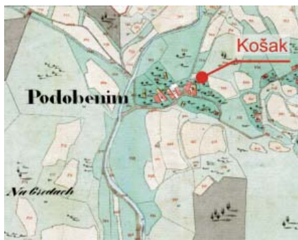
Kmetija pri Košaku v Podobenu, št. 3 je na desni strani vasi. Sedaj Podobeno, št. 3 in priimek Oblak.