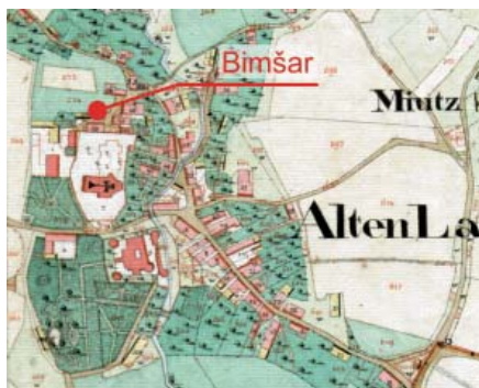
Binšarjeva kajša v Stari Loki, št. 49, tik ob mežnariji za farno cerkvijo sv. Jurija. Sedaj Stara Loka 64, kjer ima starološka župnija večnamensko Jurjevo dvorano.