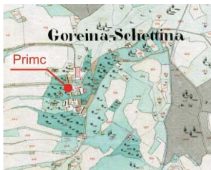
Primcova domačija sredi vasi v Gorenji Žetini, št. 9. Hiša je bila med 2. svetovno vojno požgana, sedaj Gorenja Žetina, št. 10, priimek Peternelj.