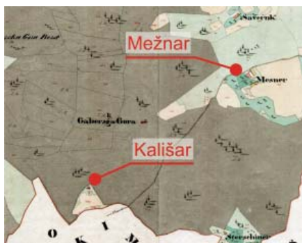
Mežnar na Gabrški Gori, št. 10 in kajža Na Kališ, št. 9, levo pod cerkvijo sv. Primoža in Felicijana. Kajža je že podrt, pri Mežnarju pa je sedaj Gabrška Gora, št. 7 in priimek Dolenc.