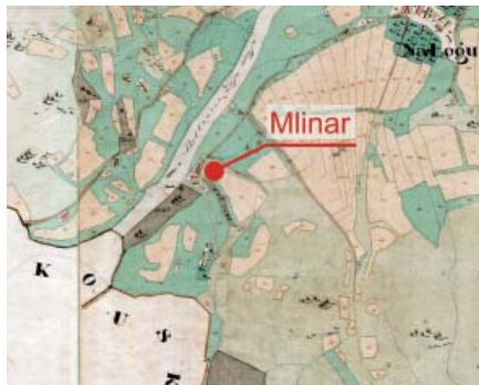
Mlinar v Logu nad Škofjo Loko, št. 4, kjer se Sovpat izliva v Poljanščico. Sedaj Log nad Škofjo Loko, št. 9 in priimek Stanonik.